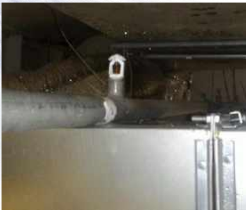
Ороситель, смонтированный в трубе над воздуховодом