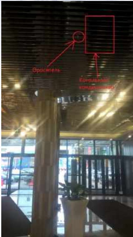
Ороситель в непосредственной близости с кондиционером

При установке оросителя в непосредственной близости к источникам света или приборам, нагревающим термочувствительную жидкость, может произойти сработка системы.