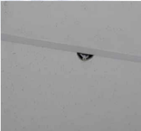
Неправильный монтаж оросителя в потолке типа «Армстронг»

Для монтажа оросителей в подвесные потолки применяют специальные аксессуары: декоративный отражатель, устройство углубленного монтажа или вариант исполнения скрытого оросителя.