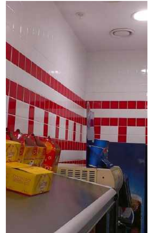
Ороситель на кухне фуд-корта над кофемашиной.