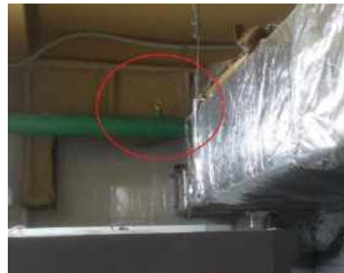
Ороситель смонтированный в помещении с холодильным оборудованием, вблизи с нагревательным элементом (компрессором)