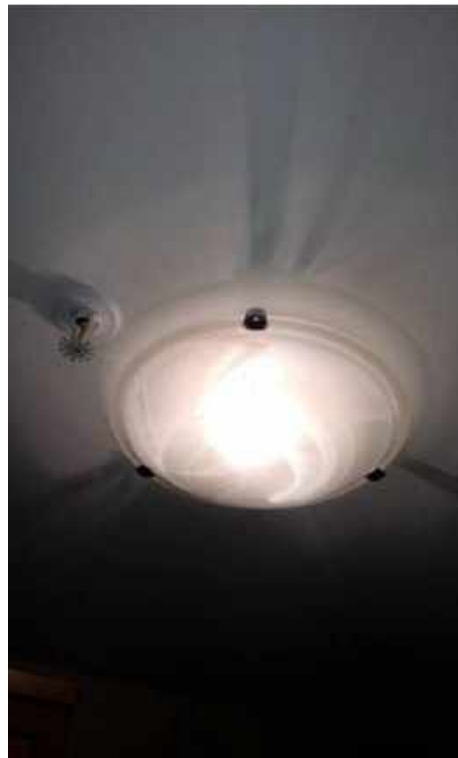
Ороситель в непосредственной близости со светильником