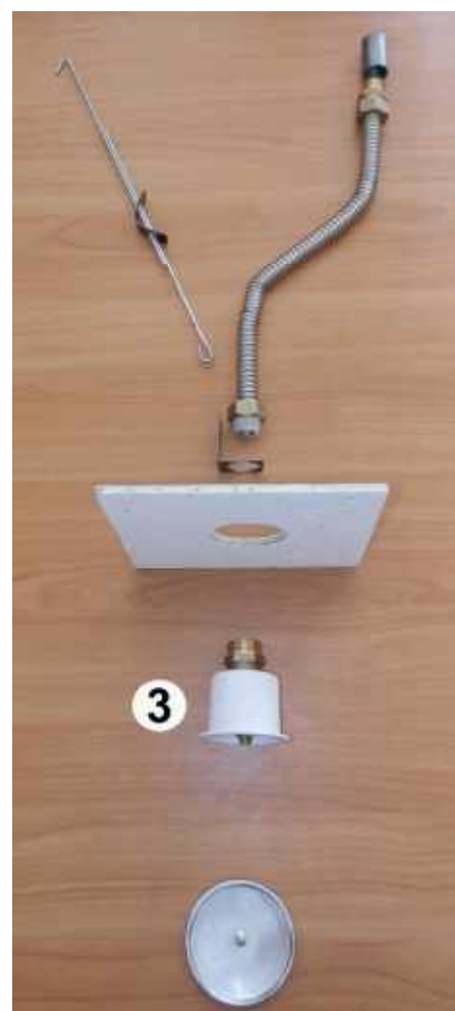
3. Установить ороситель в сборе с муфтой и держателем в патрон