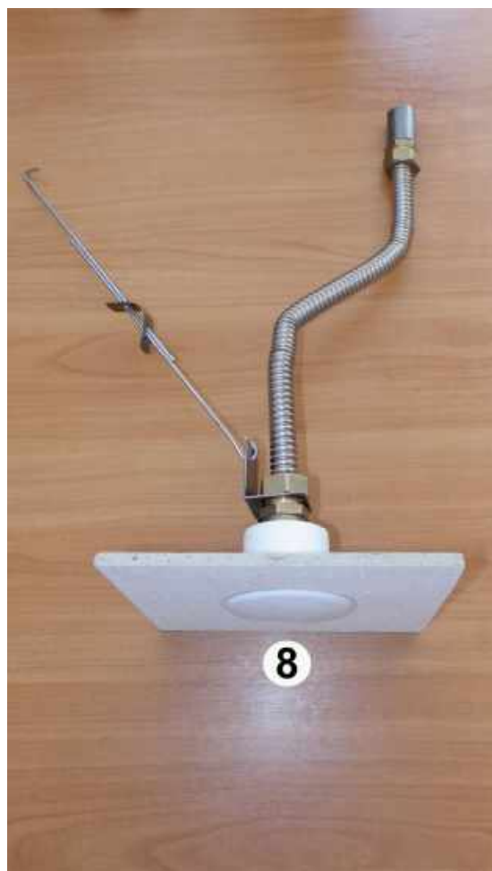
8. Установить крышку на ороситель