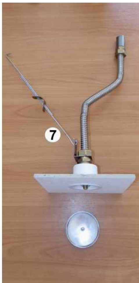
7. Зафиксировать положение оросителя с помощью подвеса