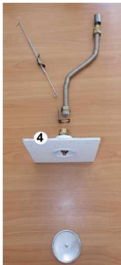
4. Зафиксировать патрон с оросителем во фрагменте подвесного потолка