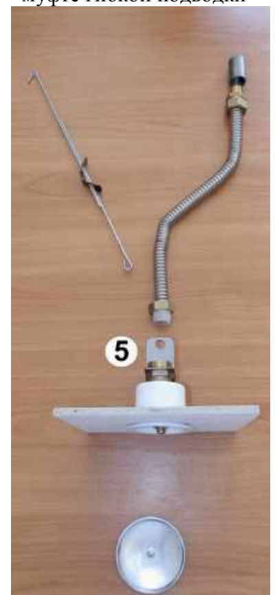
5. Установить кронштейн на муфту гибкой подводки