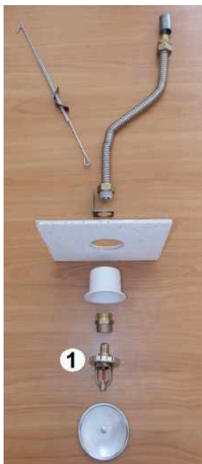
1. ВВернуть ороситель в держатель до упора