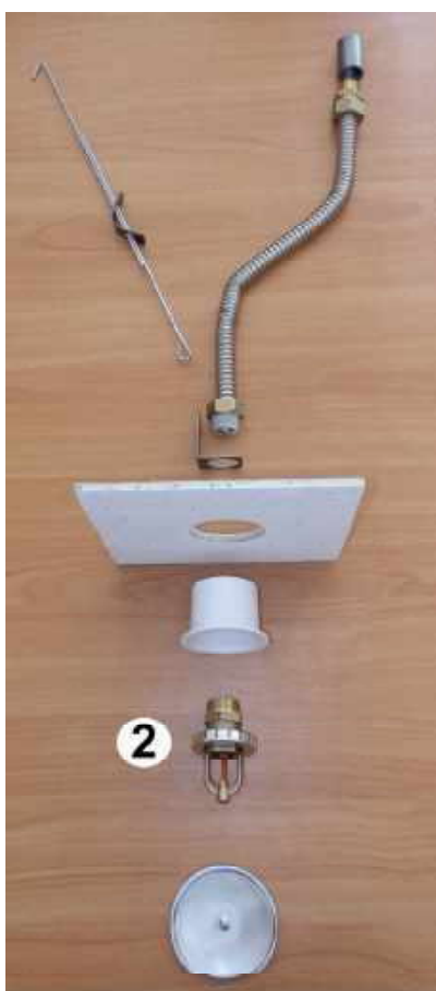
2. Присоединить ороситель в сборе с держателем в муфте гибкой подводки